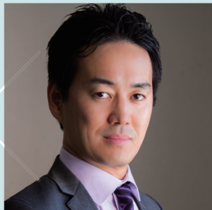
訳者 宮田 真 セントルイス大学小児外科